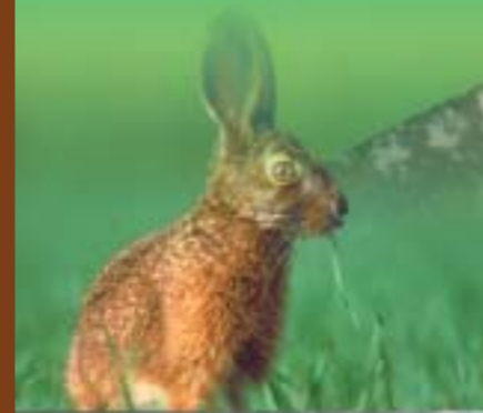
Schéma départemental de gestion cynégétique de la Meuse

APPROUVÉ PAR ARRÊTÉ PRÉFECTORAL N°2006 - 0188 DU 13 JUILLET 2006